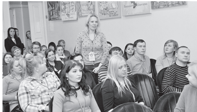
У участников семинара было много вопросов

Представителей профсоюзов учили, как избежать конфликтной ситуации, как найти мирные пути решения трудовых споров. Педагоги считают, что ультиматумом ничего не решишь, что профсоюз должен искать компромисс с работодателем. В течение двух дней прошли занятия по психологии, юридическим и налоговым вопросам, охране труда, информационным технологиям.