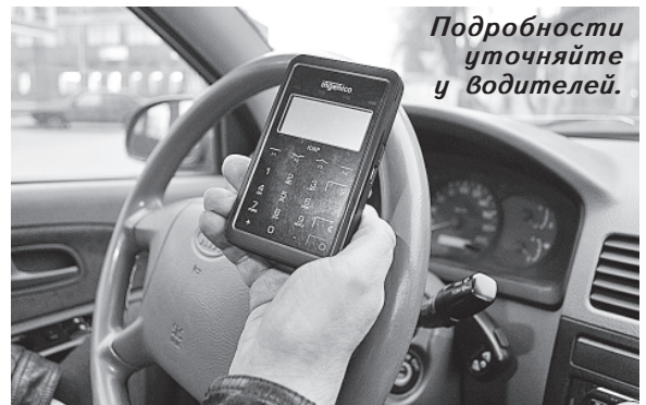
Подробности уточняйте у водителей.

Телефоны: 55555, +7-921-19-55555 8-800-550-5547 (звонок бесплатный).