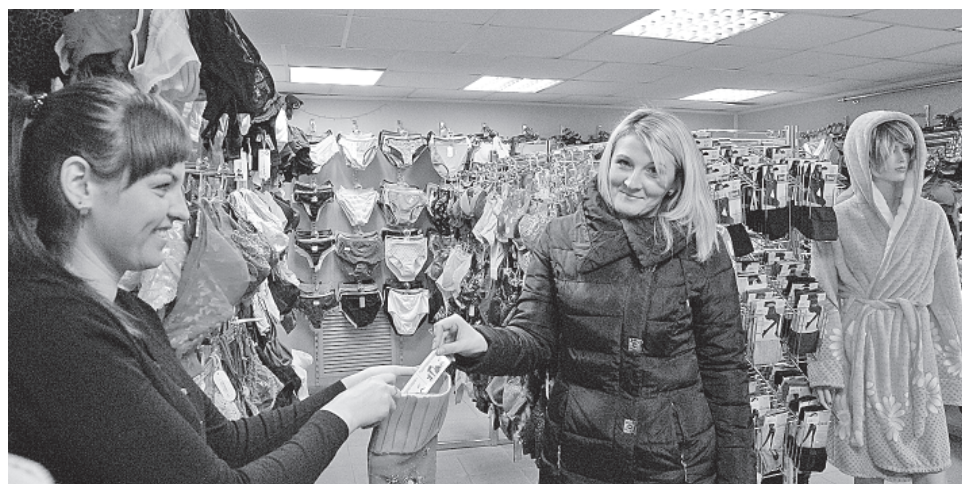
Наш адрес: ул. Коммунарная, 21 (напротив городской стоматологии), тел. 8-963-369-68-68.

тавят у себя в качестве подтверждения. Лицо независимое будет вытаскивать купоны по одному до тех пор, пока не определятся семь покупателей. Они перейдут во второй тур, и именно между ними будут разыграны семь призов. Участвовать во втором туре будет не просто покупатель, а все накопленные им купоны, что увеличивает шансы на выигрыш более активных клиентов.